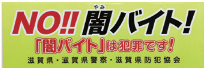
◁マグネットシート作成