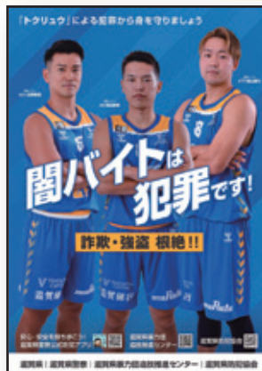
クリアファイル作成▷

協会では、滋賀レイクス、滋賀県、滋賀県警察、滋賀県暴力団追放センターと協同して、トクリュウの闇バイト犯罪への警戒を呼びかけるクリアファイルを作成し、レイクスの試合観戦者などを中心に配布することとしました。